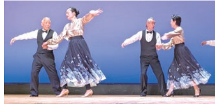
きゅりあんでの発表会