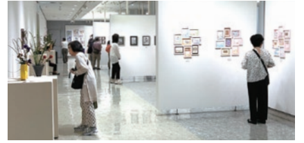
○美術館での展覧会