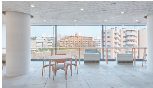
2階ラウンジ(改修後)

建築当時の特注タイル天井を活かしたクラシックモダンな空間。快適な開かれた劇場を体現する。