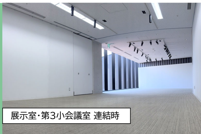
展示室・第3小会議室 連結時

※展示室・第3小会議室一体利用は合わせて申しいただくことで上記金額でご利用いただけます。