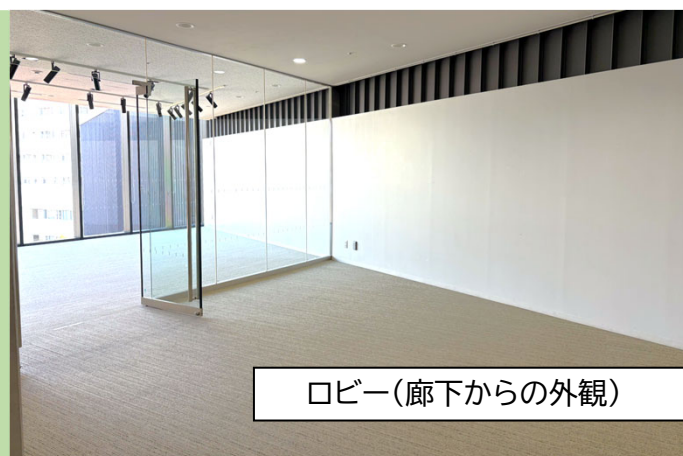
ロビー(廊下からの外観)