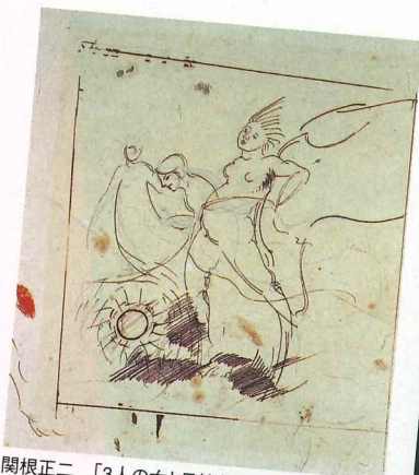
関根正二「3人の女と日輪」 1919年 (19才) 紙・鉛筆・ペン 19.4×19.6