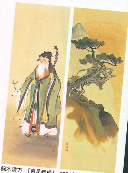
鏡木清方「寿星老松」 1894年 (16才) 絹本着彩 2幅 99.2×34.8