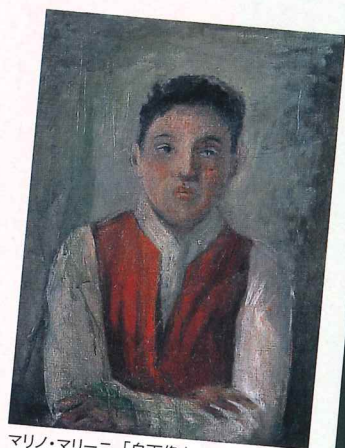
マリノ・マリニ「自画像」 1920年 (19才) 油彩 60.8×45.5