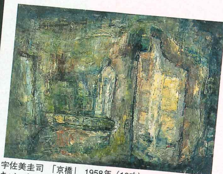
宇佐美圭司「京橋」 1958年 (18才) キャンバス・油彩 60.6×80.3