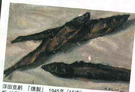
浮田克躬「燦製」 1945年 (15才) 板・油彩 38.5×43.5