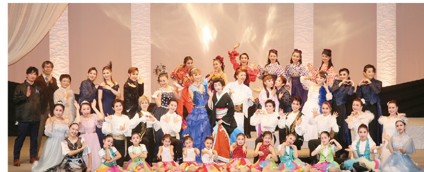
《実施概要》●日時:2023(令和5)年1月29日(日) [2回公演] ●会場:スクエア荏原