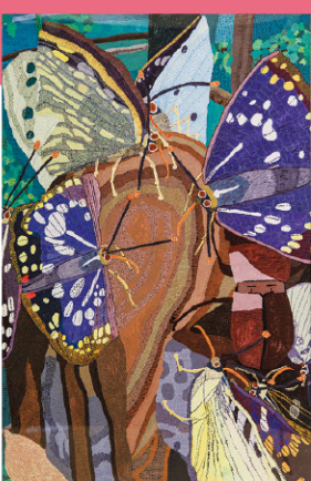
大賞・内閣総理大臣賞受賞作品 「オオムラサキたちが休んでいるところ」 勢川 貴雄 作

主催/公益社団法人 東北障がい者芸術支援機構 後援/品川区、東京新聞 協力/公益財団法人 品川文化振興事業団