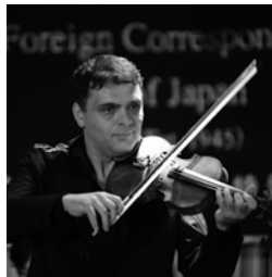
ヴァスコ・ヴァッシレフ © 中島英雄