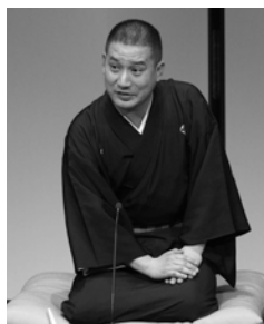
春風亭一之輔

21人抜きで真打昇進をはたした春風亭一之輔。武蔵小山生まれ、実力派の桂宮治。紙切り界のホープ林家二楽。江戸前の粋な芸をお楽しみください。