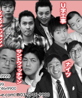
春風亭一之輔

※3歳以上有料、3歳未満入場不可。 ※車椅子をご利用の方は、チケット購入前にお問い合わせください。