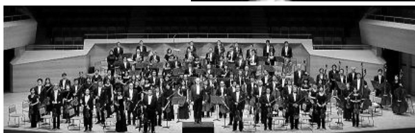
日本フィルハーモニー交響楽団

※メイプルカルチャーセンターにて、当日のリハーサルが見学できる関連講座あり！詳しくは裏面をご覧ください。