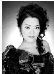
藤澤みどり(ソプラノ)