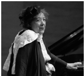
フジコ・ヘミング